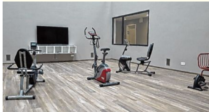
Sogar ein Fitnessraum ist vorhanden.