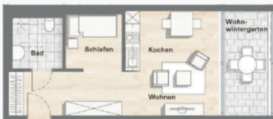
Grundriss 1-Zimmer-Apartment ca. 40 - 50 qm