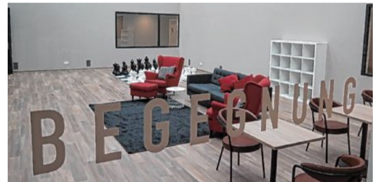
Der geräumige Aufenthaltsraum bietet Gelegenheit zum geselligen Zeitvertreib.