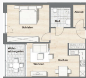
Grundriss 2-Zimmer-Apartment ca. 50 - 60 qm