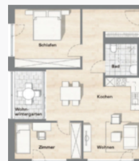
Grundriss 3-Zimmer-Apartment ca. 65 - 78 qm