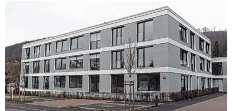
Der „Oberdorfer Hof“ ist nun fertiggestellt und an den Malteser Hilfsdienst übergeben worden.